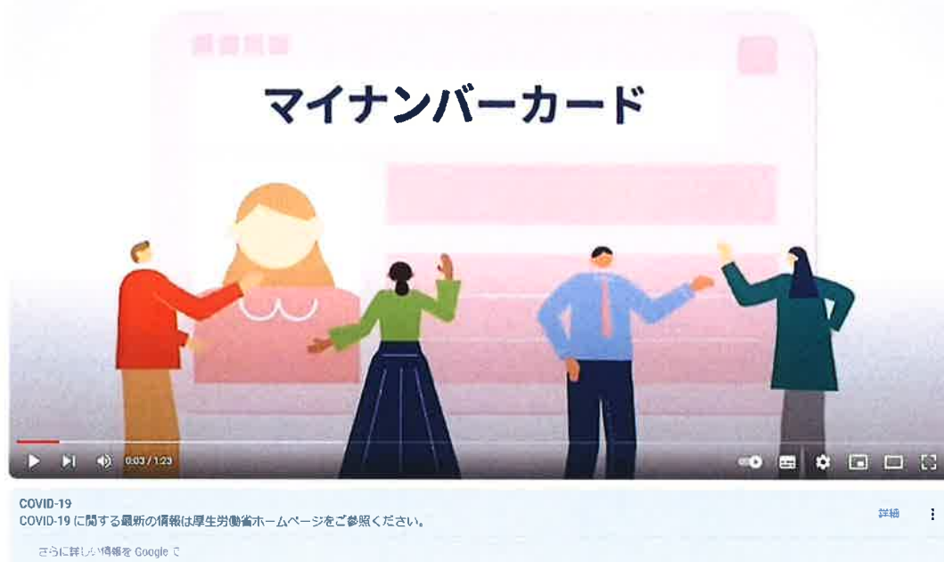
マイナンバーカード「いま」と「これから」

マイナンバー 制度「報告」と「対策」 (youtube.com) https://www.youtube.com/watch?v=cPGselFiWxc