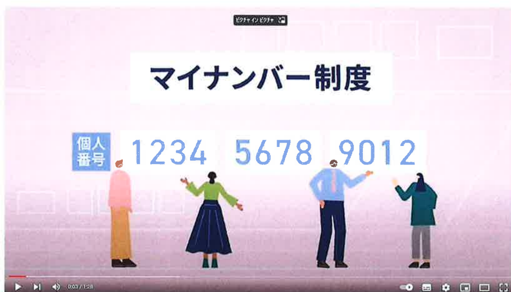
マイナンバー 制度「報告」と「対策」