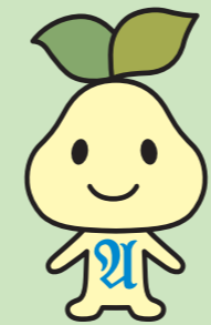
アーテム公式キャラクター イブッキー